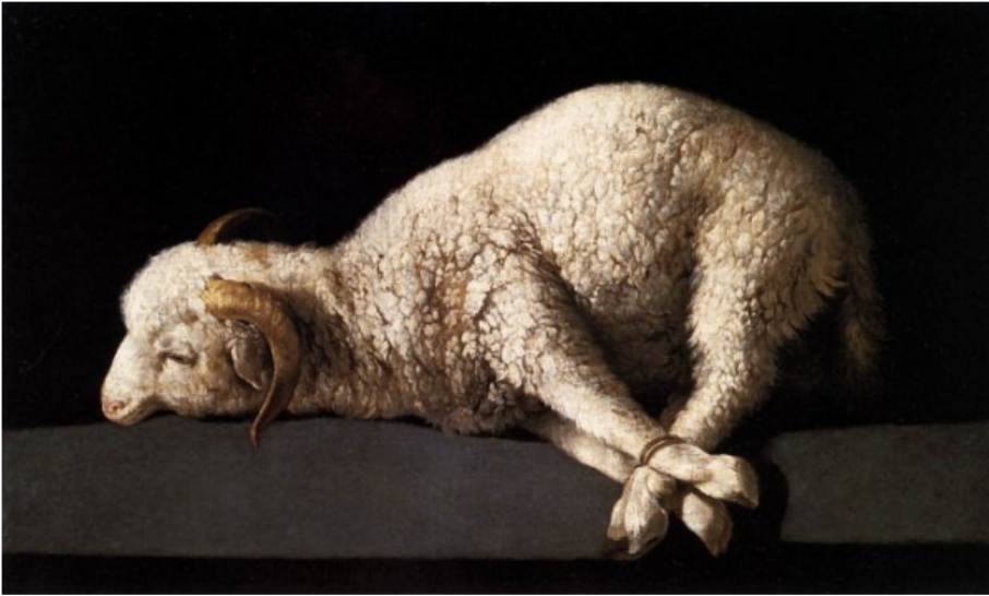
Afbeelding: lam geschilderd door Francisco Zurbarán